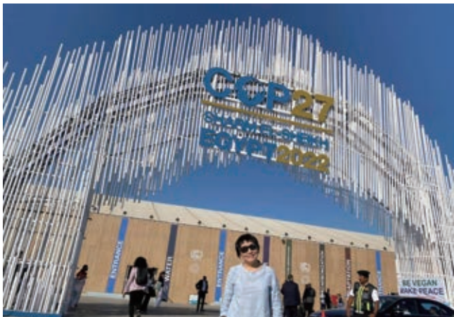
COP 27在埃及夏姆錫克舉辦。

聯合國第27屆氣候變遷締約國大會(COP27)，已經於去(2022)年11月6-18日在埃及夏姆錫克(Sharm El Sheikh)舉辦。接續2021年在英國格拉斯哥所舉行的COP26，COP27計有22000位談判代表，14000位非政府組織觀察員，4000名記者參加，大會秘書處最後統計的報名人數接近5萬人。