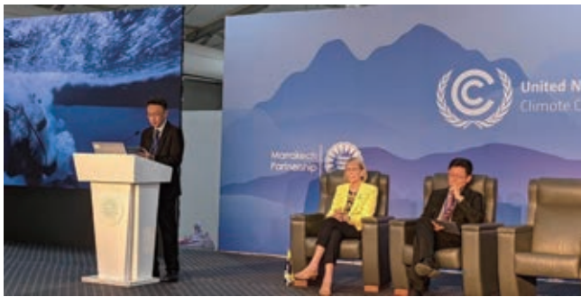
台達電子文教基金會於會場舉辦珊瑚復育邊會。

取到行動工坊(Action Hub)大型場館的主辦資格。另一場邊會則以金門、蘭嶼離島電網、儲能課題切入，邀請西班牙Balearic、Canary島嶼代表同場分享離島發電故事。