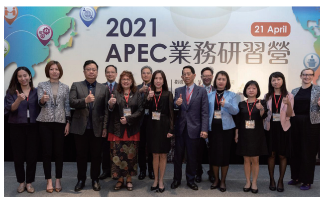
(與會致詞貴賓、主持人、講者大合照)

APEC研究中心於2021年4月21日，假台北喜來登大飯店福廳盛大舉辦年度APEC業務研習營。APEC業務研習營係研究中心每年舉辦之重要活動，與會對象為國內APEC議題主政機關之相關業務承辦人員，本年總共約90人與會。活動目的在深化各主政機關對APEC事務之瞭解與參與、協助各業務承辦人員強化幕僚角色、提供APEC會議程序、慣例與實作經驗之交流平台，並提升我國在APEC事務之跨部會合作。